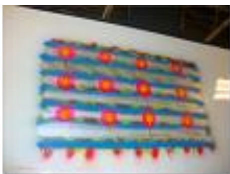
9 Peinture MOTIP résistante à la chaleur