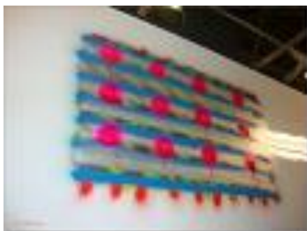
8 Peinture nitro-cellulosique MOTIP jaune fluo