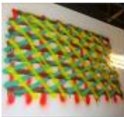
5 Peinture acrylique MOTIP RAL 5019