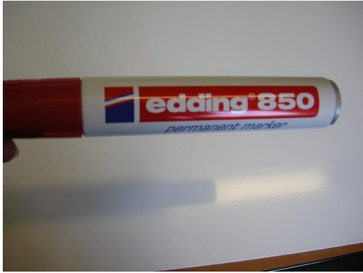
4 marqueur permanent EDDING 850, couleur vert