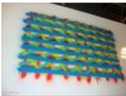
6 Peinture acrylique MOTIP RAL 9006 couleur métal