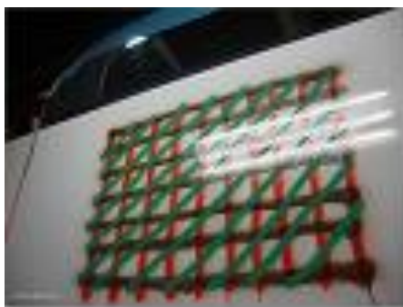
4 Peinture acrylique MOTIP RAL 1021